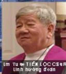
Lm. YU 俞 TIẾN LỘC CSsR Linh hướng đoàn